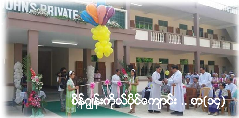
စိန်ဂျွန်းကိုယ်ပိုင်ကျောင်း .. စာ(၁၄)