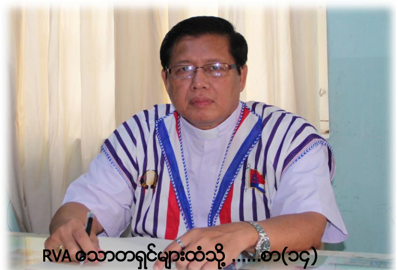
RVA စာတတ်ရင်များထံသို့ ... စာ(၁၄)