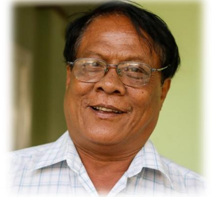
ဆိုင်ရာကော်မတီနှင့် တောင်သူလယ်သမားရေးရာကော်မတီအဖွဲ့ဝင်အဖြစ်လည်းပါဝင်လုပ်ဆောင်လျက်ရှိသည်။

ရွေးကောက်ပွဲတွင် လွှတ်တော်ကိုယ်စားလှယ်အဖြစ်လည်းကောင်း၊ ၂၀၁၂ ခုနှစ် ကြားဖြတ်ရွေးကောက်ပွဲတွင် အမျိုးသားလွှတ်တော်ကိုယ်စားလှယ် အဖြစ်လည်းကောင်း၊ ၂၀၁၅ ခုနှစ် ရွေးကောက်ပွဲတွင် တိုင်းဒေသကြီးလွှတ်တော် ကိုယ်စားလှယ်အဖြစ်လည်းကောင်း ဝင်ရောက်ယှဉ်ပြိုင်အနိုင်ရခဲ့သည်ဟု သိရသည်။ သူသည် အမျိုးသားလွှတ်တော် အာဆီယံ နိုင်ငံရေးနှင့် လုံခြုံရေး အသိုက်အဝန်း