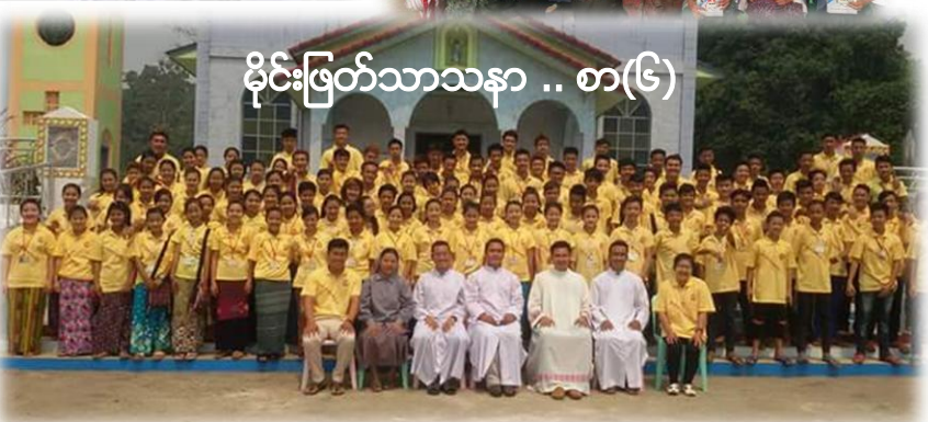
မိုင်းဖြတ်သာသနာ .. စာ(၆)