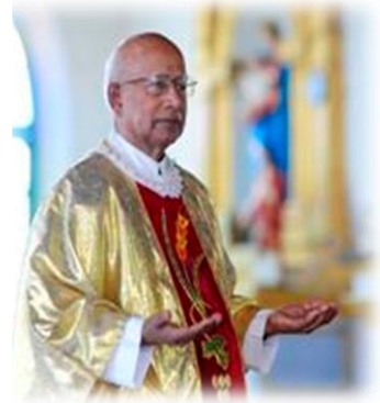
Fr. စတန်းနစ် နှစ် ၅၀ .. စာ(၉)