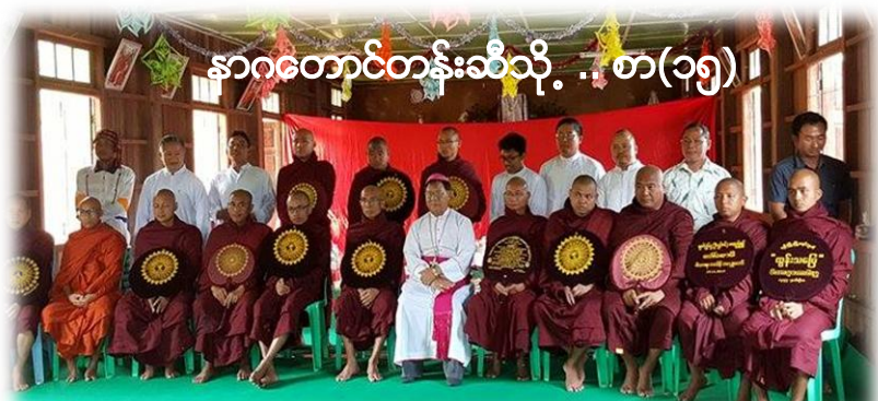
နာဂတောင်တန်းဆီသို့ .. စာ(၁၅)