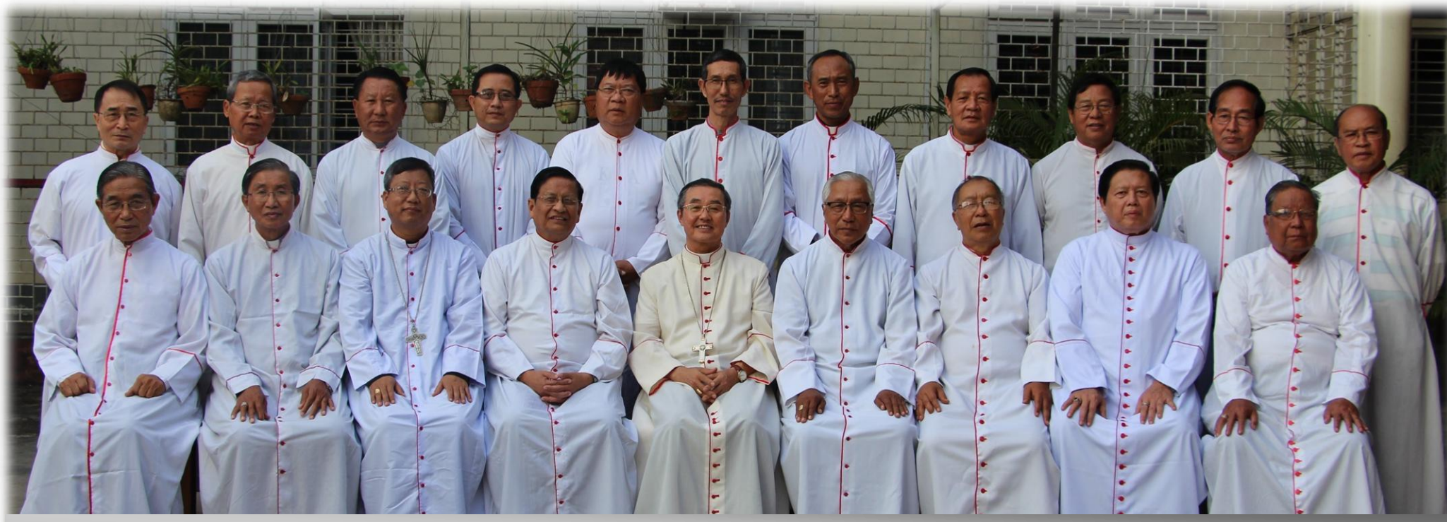
မြန်မာနိုင်ငံကက်သလစ် ဆရာတော်ကြီးများ ၂၀၁၆ ခုနှစ်

(၅၀)ကြိမ်မြောက် ကမ္ဘာ့လူထုဆက်သွယ်ရေးနေ့ မေလ(၈)ရက်နေ့၊ ၂၀၁၆ ခုနှစ် (ဆက်သွယ်ခြင်းနှင့် သနားကရုဏာ၊ ကောင်းမွန်၍ အသီးအပွင့်ဖြစ်စေသောတွေ့ဆုံခြင်း)