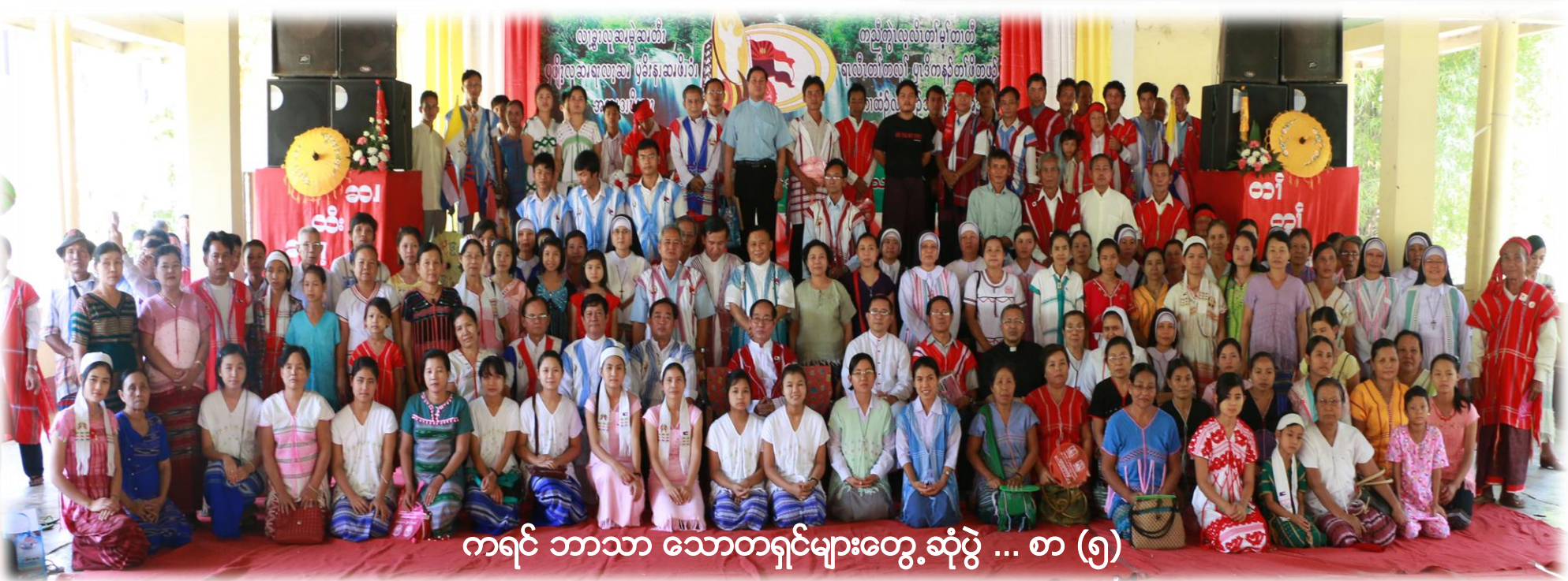
ကရင် ဘာသာ သောတရှင်များတွေ့ဆုံပွဲ ... စာ (၅)