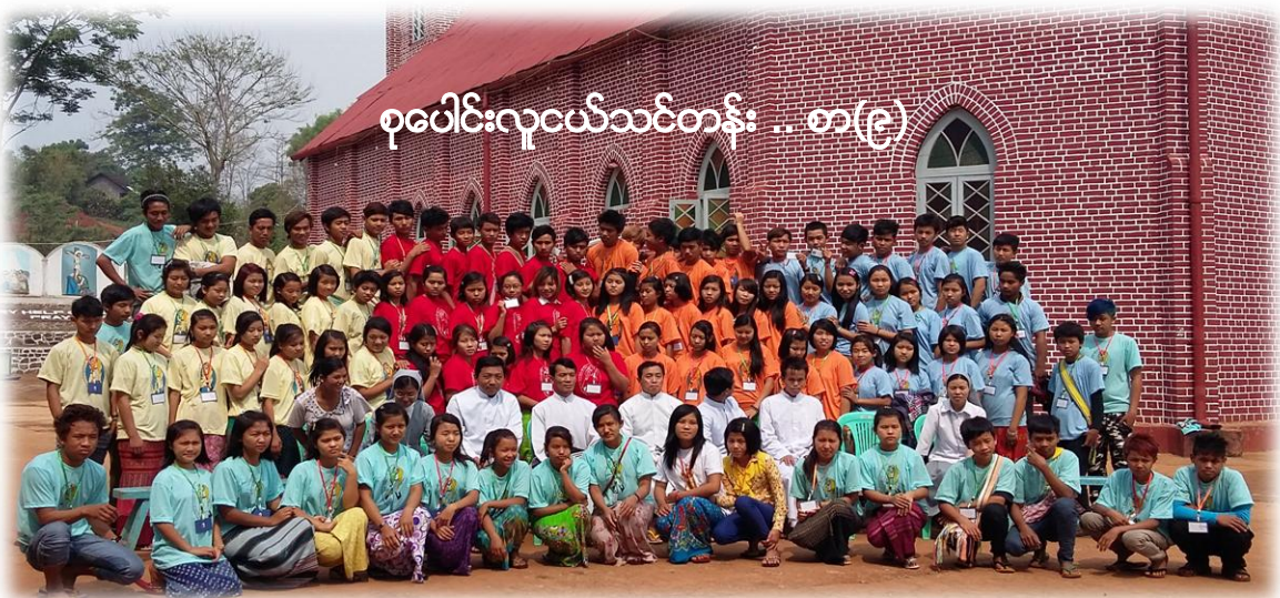
စုပေါင်းလူငယ်သင်တန်း .. စာ(၉)

(50 th World Communication Day May 8, 2016. Communication and Mercy: A Fruitful Encounter.