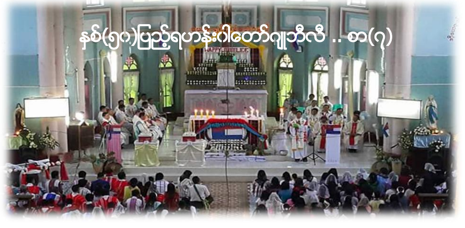
နှစ်(၅၀)ပြည့်ရဟန်းဝါတော်ဂျူဘီလီ .. စာ(၇)