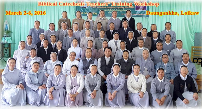
Biblical Catechesis Teachers' Training Workshop March 2-6, 2016 Daungankha, Loikaw