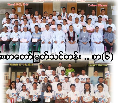
ကျမ်းစာတော်မြတ်သင်တန်း .. စာ(၆)