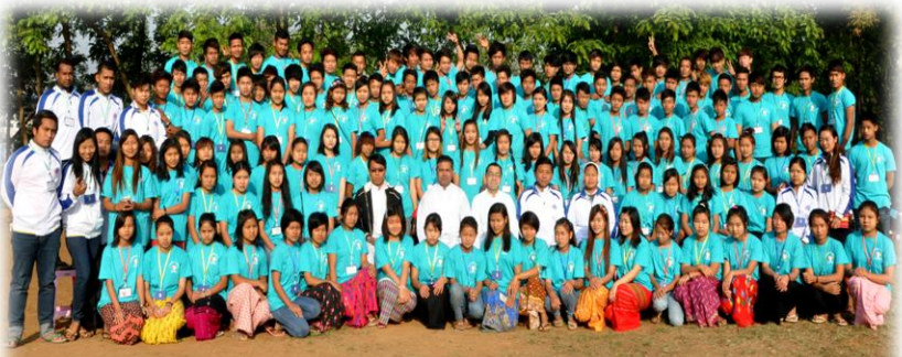
လားရှိုးသာသနာ လားရှိုးတိုက်နယ် အင်အားစုပွဲပြီးစရေးလူငယ်သင်တန်း ၂၃-၂၈.၃.၂၀၁၆