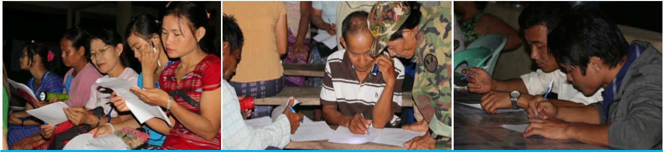
RVA သောတရှင် စစ်တမ်းကောက်ယူကာ၊ မေးခွန်းများဖြေဆိုနေကြစဉ်

RVA ကရင်ဘာသာ အစီအစဉ်၏ သောတ ရှင်တွေ ဆုံပွဲနှင့် နှစ်ပတ်လည်အစီအစဉ်ကို ဧရာဝတီ တိုင်း၊ ဝါးခယ်မမြို့နယ် ကနစိုးကုန်းကျေးရွာတွင်၊ မတ် လ (၃၁) ရက်နေ့မှဧပြီလ (၁) ရက်နေ့ထိ ကျင်းပ ခဲ့ပါ သည်။ (၃၁)ရက်နေ့တွင် ရပ်နီးရပ်ဝေးမှ RVA သောတ ရှင် အသီးသီးညအိပ်တည်းခိုရန် ရောက်ရှိလာကြ သော၊ ထိုနေ့ညနေ၌၊ ညနေစာ သုံးဆောင်အပြီး၊ ည(၇)နာရီ မိနစ် (၃၀) တွင်၊ အဖွင့် ဆုတောင်း မေတ္တာ ဖြင့် အစီအစဉ်ကို စတင်ခဲ့ပါသည်။ အဖွင့်မေတ္တာ အပြီး တွင်၊ ကနစိုးကုန်းကျောင်းထိုင် ဘုန်းတော်ကြီး ဖာသာရ် ကာရိုလုဒ်(စ်)၏ ကြိုဆိုနှုတ်ဆက်အမှာစကားကို၎င်း၊ ကရင်ဘာသာအစီအစဉ်မှ ဖာသာရ်ဟင်နရီ အိုင်ခလိန် တို့၏ အဖွင့်အမှာစကားကို၎င်းကြားနာခဲ့ကြပြီး ချမ်းသာ ကုန်းသာသနာမှ သက်ထွေးကလေးငယ်များ၏ အဖွင့် နှုတ်ဆက်သီချင်း ကရင်အမျိုးသားရေး စုံတွဲသီချင်း၊ ကရင်ဒုံးယိမ်းအကတို့ဖြင့်လှပညီညာစွာ တင်ဆက်ဖျော် ဖြေခဲ့ကြကာ၊ RVA ကရင်ဘာသာအစီအစဉ်တာဝန်ခံ၊ ဖိလစ်ပိုင်မှ ဖာသာရ်စောဟူးဆတ်က အာဗီအေ နှင့် အင်တာနက် အွန်လိုင်းအစီအစဉ်အကြောင်းကို ဝီနိုင်း ပုံကြီးများဖြင့်၊ အကျယ်တဝန် ရှင်းပြခဲ့ပြီး၊ မြန်မာဘာသာ အစီအစဉ်ဖိလစ်ပိုင်မှစတုတ္ထတန်းလှည့်သောအောင်က အနည်းငယ်ဖြည့်စွက်ကာဝေငှ ရှင်းလင်းပေးခဲ့ပါသည်။ ထို့နောက် RVA သောတရှင်စစ်တမ်းကောက်ယူကာ၊ မေးခွန်းများဖြေဆိုခဲ့ကြပါသည်။