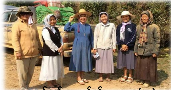
ဆက်ကပ်သူတော်စင်များ .. စာ(၁၀)