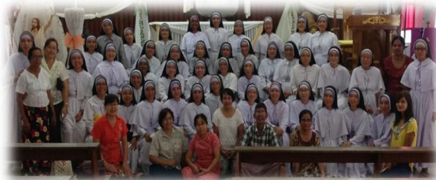
ရန်ကုန်နှင့်ပြည်နယ်များရှိ သီလရှင်များ .. စာ(၇)