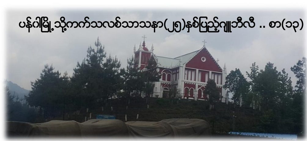
ပန်ဂါမြို့သို့ကက်သလစ်သာသနာ(၂၅)နှစ်ပြည့်ဂျူဘီလီ .. စာ(၁၃)